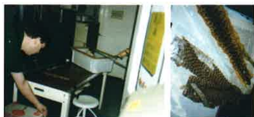
図4. デモ形式授業で画像診断(左)と皮膚病(右)の様子