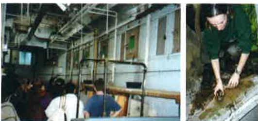
写真1. ロンドン動物園Reptile Houseのバックヤード視察の様子