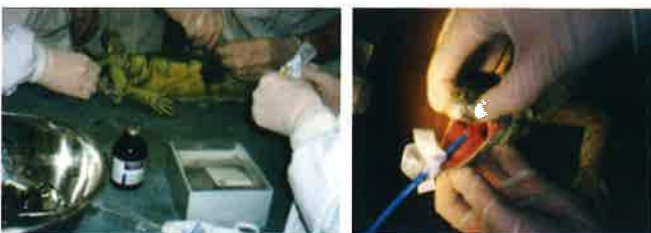
図3. グリーンイグアナ手術実習前、麻酔施術の様子