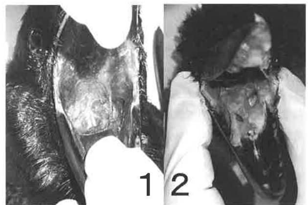
図3. 口腔内の吐瀉物と目される内容物 -1: AS 18192、-2: AS 18201

CYAPは有機リン系農薬に分類され [3] 、殺虫剤として汎用される。一般に、有機リン剤の毒性は哺乳類よりも鳥類に対して強いとされており [3] 、国外では殺鳥剤としても使用されている [4] 。有機リン系殺虫剤投与に