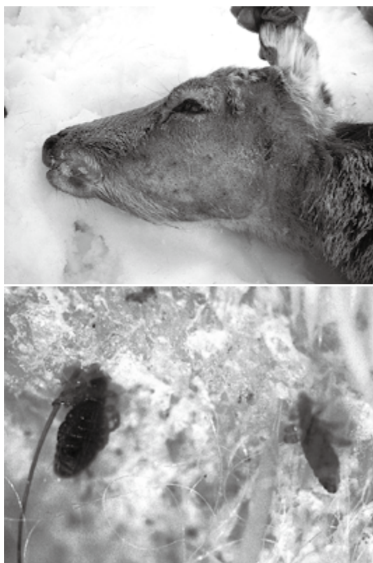
図1. 羅臼産エゾシカにおけるシラミ類 Solenopotes sp. cf. binipilosus 寄生状況. 上: 2010年捕獲個体の寄生箇所(左側頰部). WAMC-AS-11779. 下: 2005年捕獲個体の寄生箇所の拡大. 腹部に広く雌雄飽血シラミ類が観察された. WAMC-AS-11778.