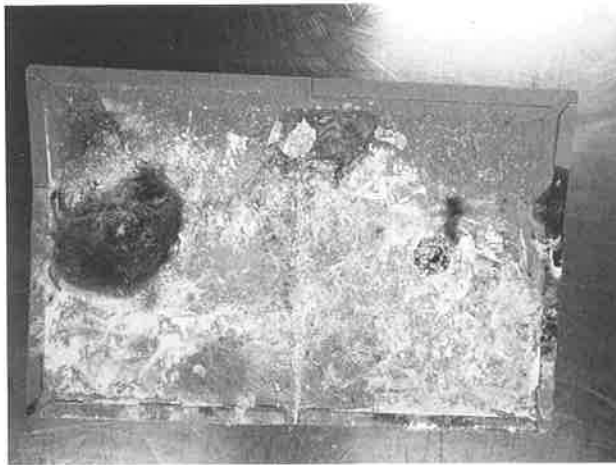
図2. トラップ上のエゾヤチネズミ死体

ゾヤチネズミ1個体の死体が確認された(図2)。ハイタカは非常に元気があり、羽ばたき意欲と食欲が認められたので、翌朝に放鳥することを決定し、その夜は自由な飲水と給餌(鶏ササミ)の後、WAMC内の入院室で経過観察した。翌朝、放鳥時には、風切羽の先端を切除した影響を見極めつつ放鳥した。少なくとも、この時、飛翔能力には影響がなかったことが確認された。