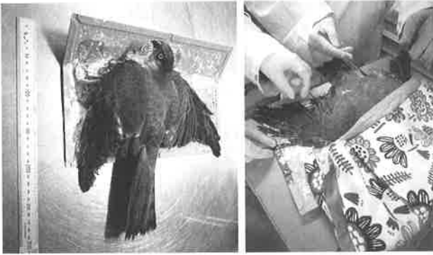
図1. 搬入直後のハイタカ(左)とその処置中の様子(右)