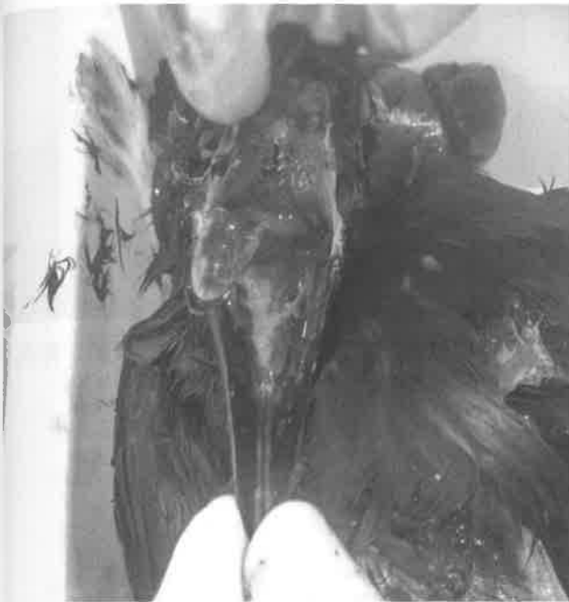
図 1. 口腔内に褐色粘液多量貯留の一例 (シアノホスが検出された AS18733 ハシブトガラス における症例)