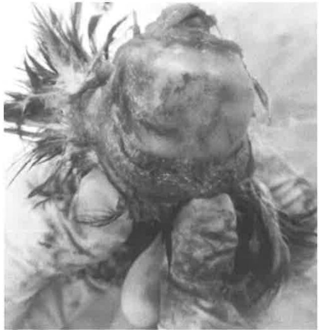
図 2. 頭蓋内出血の一例 (シアノホスが検出された AS18738 ハシボソガラス における症例)