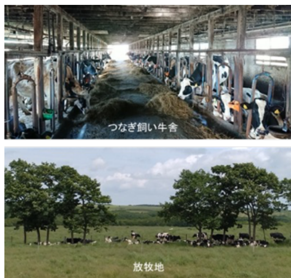
図1 調査対象酪農場の概要

また同酪農場において、2020年1月～2021年12月までの2年間における血乳の発生状況を調査し、血乳が生じた場合は1週間程度、朝夕に個体乳を採取し、血液濃度や体細胞数