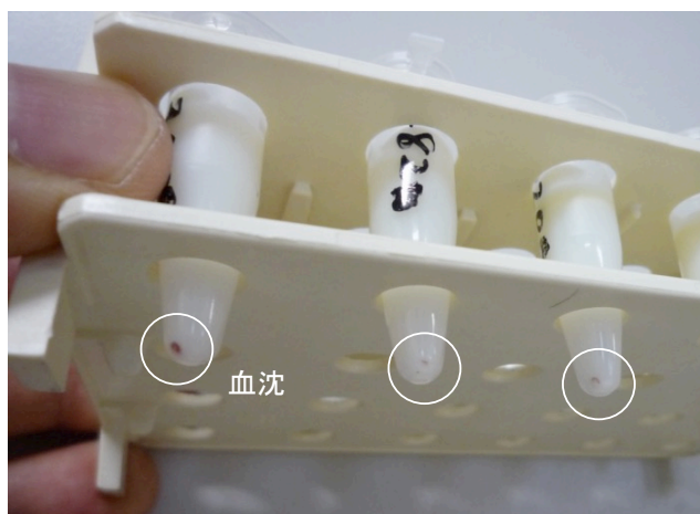
図3 高速遠心で確認された血沈の例