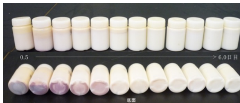
図4 個体②における搾取乳の色調や血液沈殿（自然沈降）の様子

また、血沈が生じた個体乳に含まれる血液量は高めな傾向にあるものの、血沈非検出個体乳の血液濃度平均値